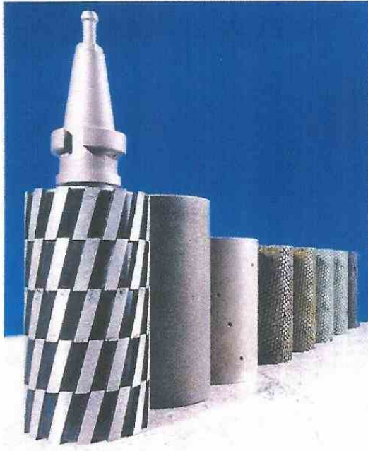
Schleif- und Polierwalzen für Hartgesteine